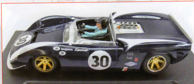
Lola T70 Spider MkII #30 - Dan Gurney

Y como coche conmemorativo de que este Mayo cumplimos ya XV años editando la revista nos han preparado una edición limitada y numerada de solo 200 unidades, con los colores negro y dorado que ya empleamos en los coches del V y X Aniversario.