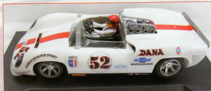
Lola T70 Spider MkIII #52 - Peter Revson