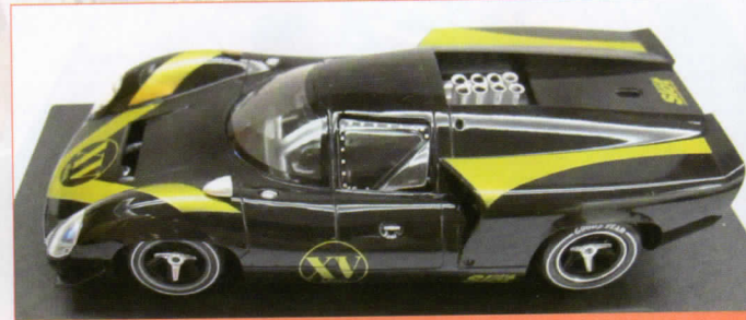
Lola T70 MkIII XV Aniversario Más Slot