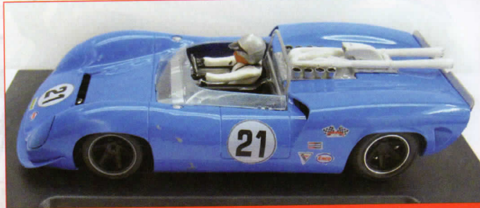
Lola T70 Spider MkIII #21 - M. Andretti