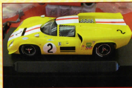
Lola T70 MKII Brands Hatch 1968