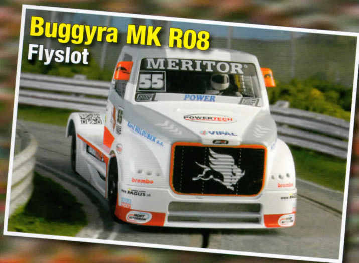
Buggyra MK R08 Flyslot