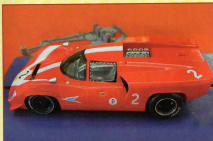
Lola T70 MKII Brands Hatch 1967