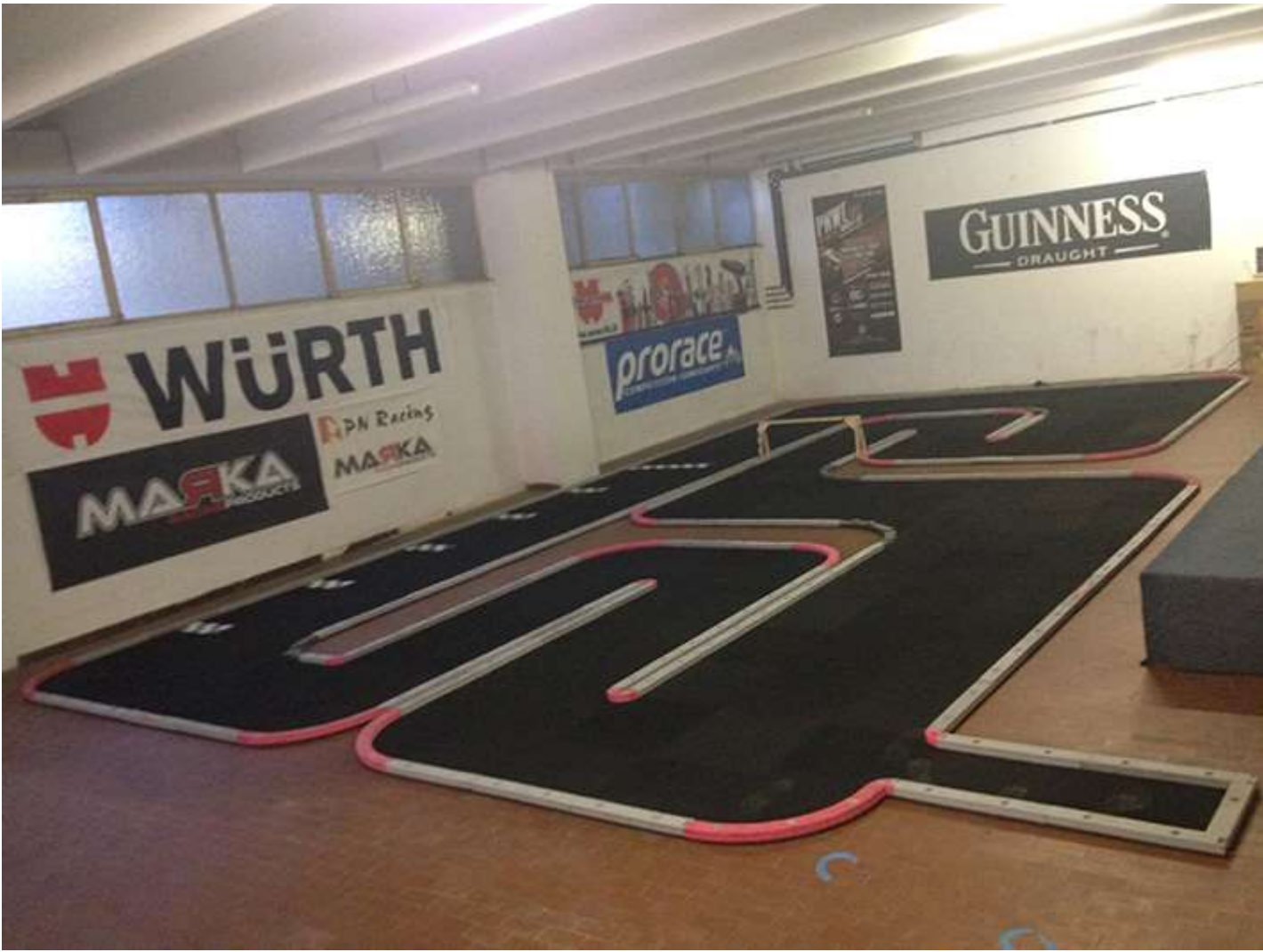
Pista Super Policar 1/24