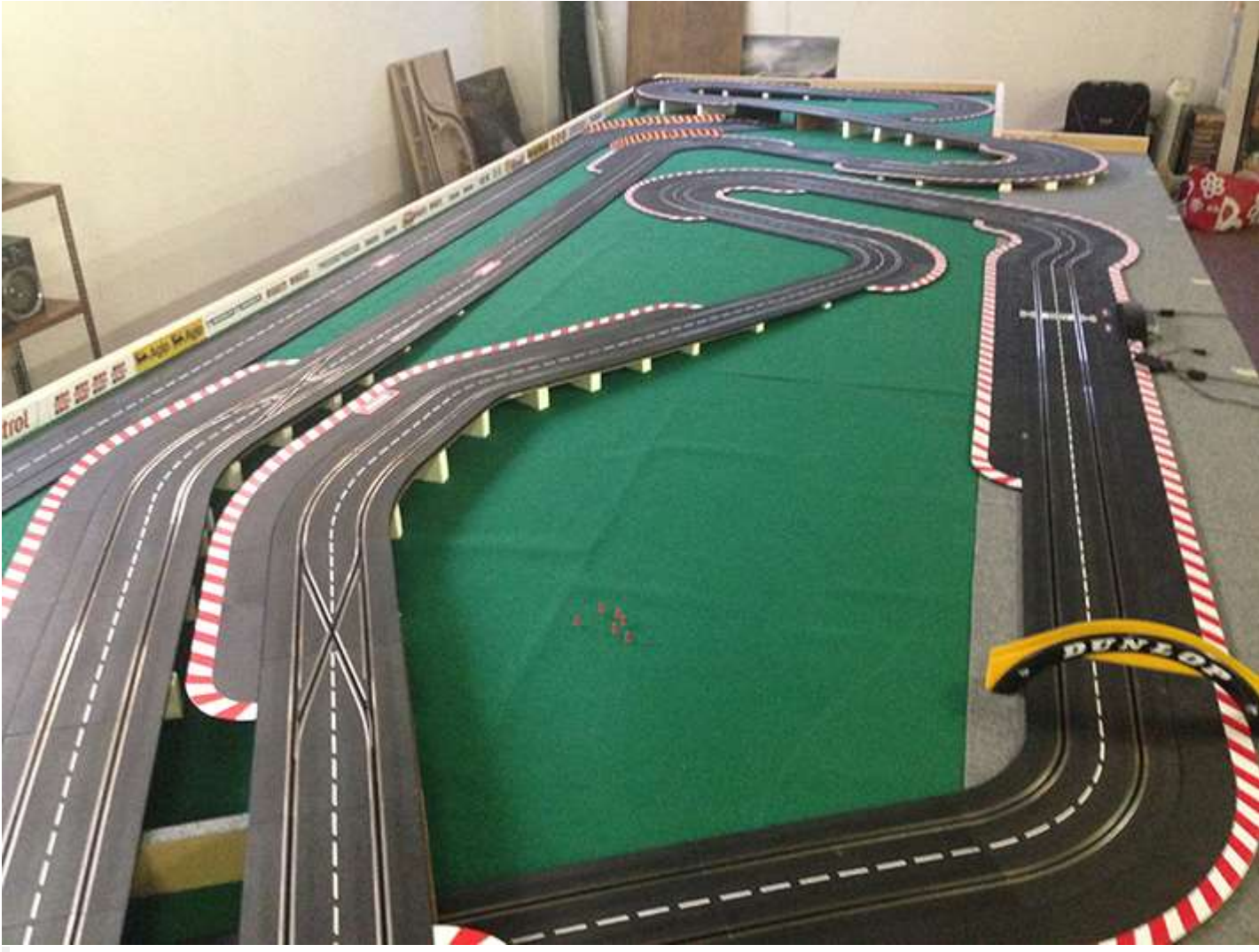
Pista Kyosho per le mini Z 1/28